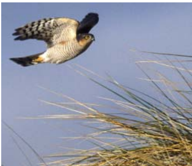
Hos sparvhöken sträcker de gamla hanarna sist under hösten.

Hos arter där ungfågeln sträcker först övervintrar en stor andel av de gamla fåglarna i närheten av häckningsområdet (t.ex. glada, duvhök och sparvhök). Sannolikt kör de dominanta föräldrarna bort ungfågeln från häckningsreviret. De tvingas därför flytta söderut. Beroende på bl.a. födotillgång följs de senare på säsongen av ett varierande antal äldre fåglar. Varför den bruna kärnhöken, en långflyttare som övervintrar från medelhavsområdet till söder om Sahara, också tillhör denna grupp och därmed skiljer sig markant från övriga långflyttare är oklart.