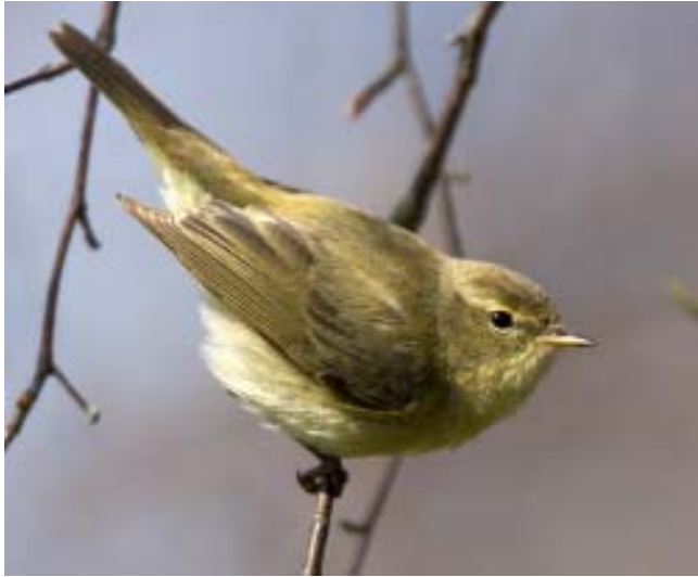
Den sydliga gransångarens ökning har i hög grad medverkat till förändringen i artens flyttningstid.

punkt som förr. Exempelen i Tabell 10 stämmer inte helt med denna hypotes. Visserligen ses en generell tendens till tidigare ankomst men det finns skillnader såväl mellan grupperna av flyttare som mellan arter inom samma grupp. Arter som övervintrar i Europa har tendens att flytta förbi under allt kortare period. Sålunda passerar rödhakarna nästan två veckor snabbare nu än under 1980-talet men trots det är mediandatum detsamma. Man kan tolka detta som att fler fåglar övervintrar längre norrut än tidigare och därför passerar sträcket snabbare (jfr. sid. 97).