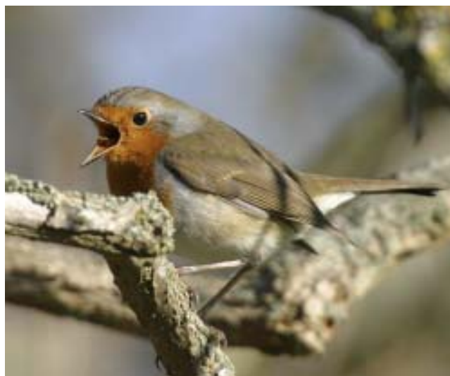
Rödhaken har en betydligt kortare vårflyttningsperiod nu än under 1980-talet.

Baserat på fångstdata har vi tagit fram ankomsttider på våren för fem arter som övervintrar i Europa och åtta arter som övervintrar i tropiska Afrika (Tabell 10). Man kan förvänta sig att det mildare klimatet i Europa medför att fåglar som övervintrar här anländer allt tidigare. Arter som övervintrar i tropikerna, däremot, är mera inställda efter solens placering på himlen för att börja sin flyttning och bör därför komma ungefär vid samma tid-