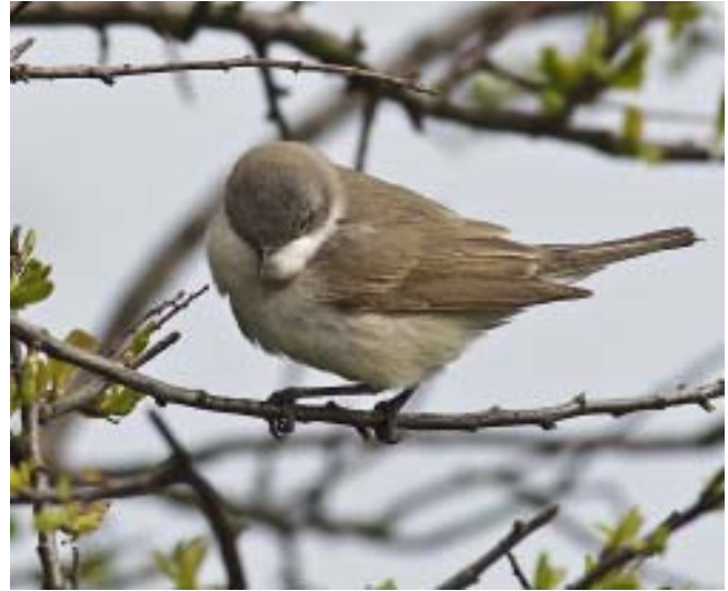
Årtsångaren anländer numera i genomsnitt fyra dagar tidigare om våren än under 1980-talet.

För arterna som övervintrar i tropiska Afrika är bilden något annorlunda. Flyttningsperioden är för flertalet arter minst lika lång som tidigare men mediandatum